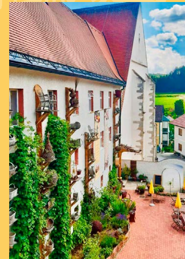
Es gibt vieles zu entdecken in den Kloster-Schul-Werkstätten

H euer begrüßen wir in den Kloster-Schul-Werkstätten Schönbach den Frühling mit vielen neuen Artikeln im regionalen Klosterladen und im Korboutlet.