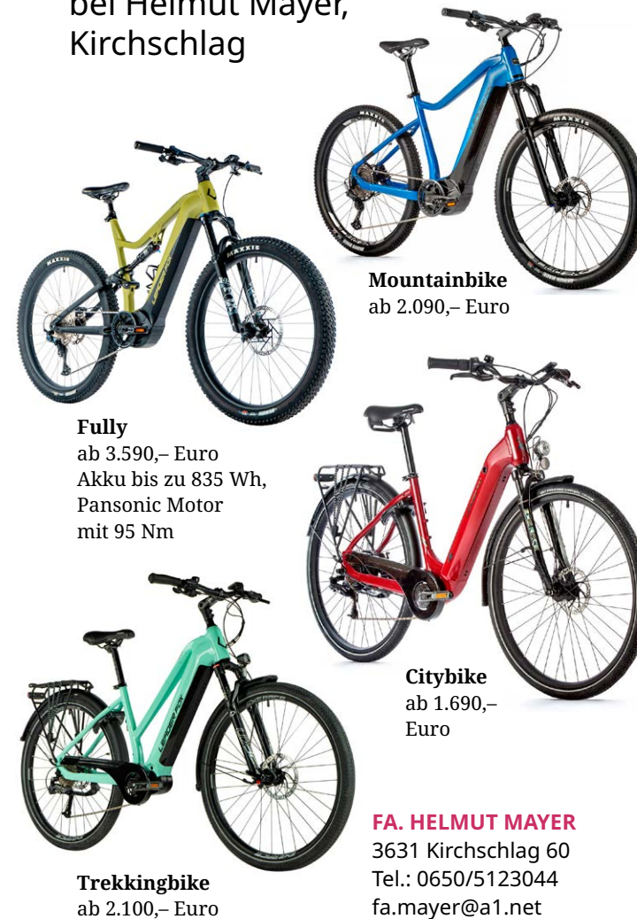
Mountainbike ab 2.090,- Euro