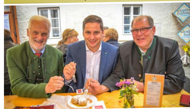
Beste Unterhaltung beim Kriecherl- und Michaelikirtag Schönbach