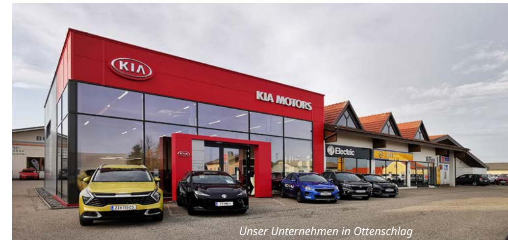
Unser Unternehmen in Ottenschlag

Stets viele lagernde und prompt verfügbare Neu-, Vorführ- und Gebrauchtwagenfahrzeuge! (in Ottenschlag und Krems)