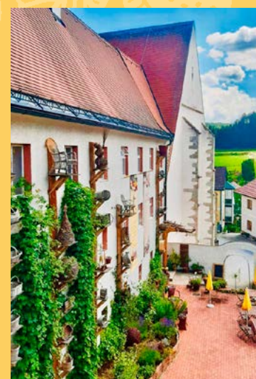
Es gibt vieles zu entdecken in den Kloster-Schul-Werkstätten

H euer begrüßen wir in den Kloster-Schul-Werkstätten Schönbach den Frühling mit vielen neuen Artikeln im regionalen Klosterladen und im Korboutlet.