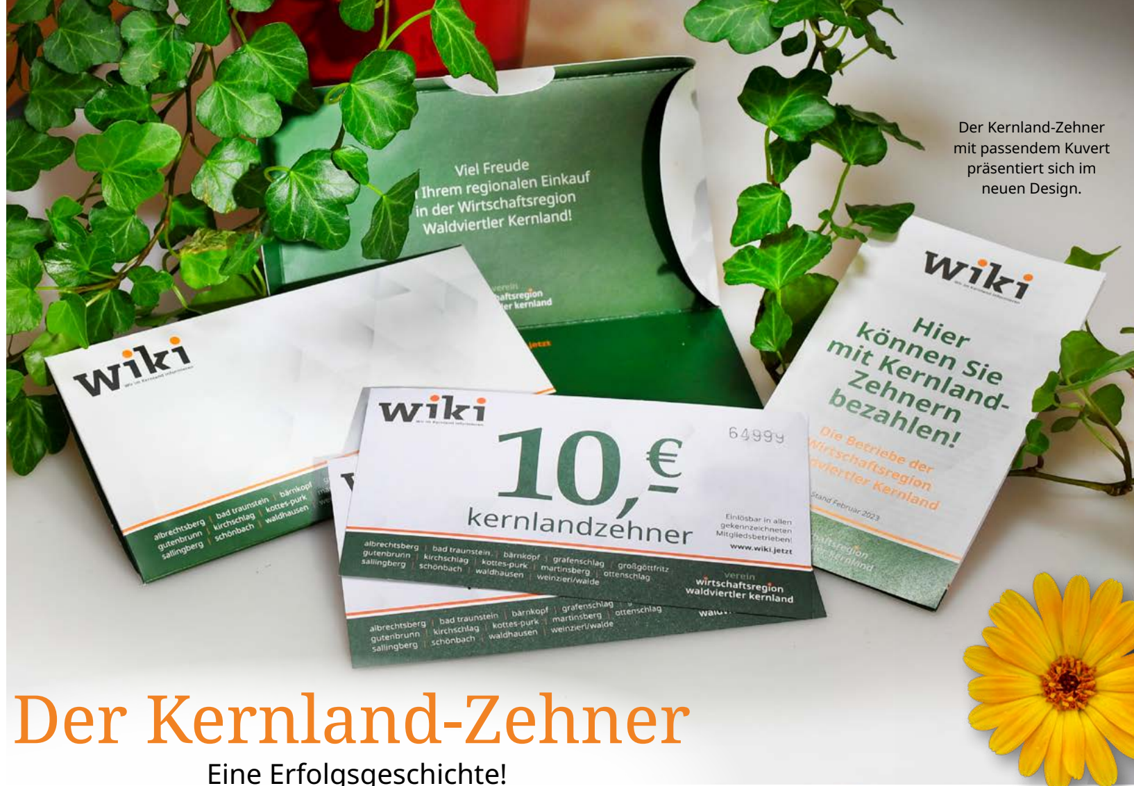
Der Kernland-Zehner mit passendem Kuvert präsentiert sich im neuen Design.