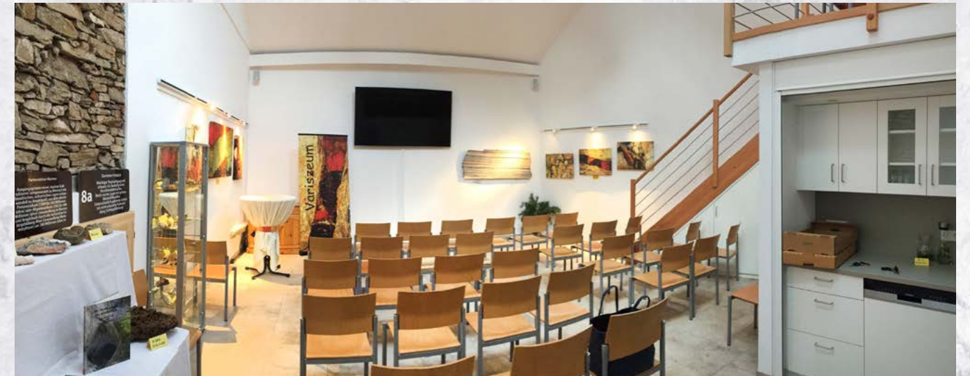
Das Besondere der Kremstaler Höhlenwelt wird im Variszeum präsentiert.

Mit der Rekonstruktion des alten Postgebäudes, eingebettet in das historische Ensemble von Burg und Dorfplatz, konnte das malerische Ortsbild erhalten werden. KR Hrachowitz ist auch Besitzer des Hauses am Hauptplatz in dem nun ein Raum als Informationszentrum – das sogenannte Variszeum – eingerichtet wurde.