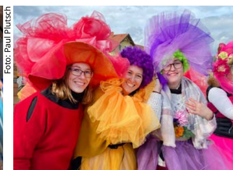
Großbildfotografien zieren das Freigelände