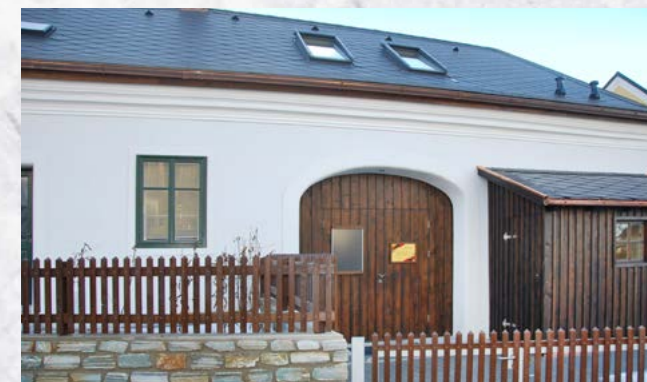
Das Variszeum kann als Veranstaltungsraum gemietet werden.

Das Informationszentrum des Kremstal Höhlenwelt Vereines „Variszeum“ wurde am 18. November 2022 am Hauptplatz von Albrechtsberg Nr. 47c offiziell eröffnet. Der Name Variszeum setzt sich aus zwei Silben zusammen: vom urzeitlichen Variszischen Hochgebirge und Museum.