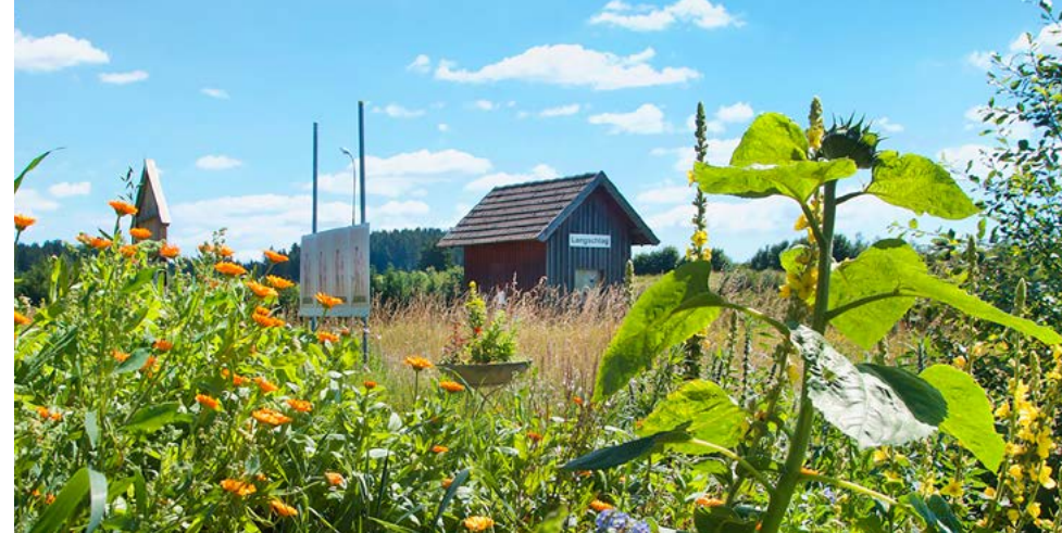
Am 20. Mai 2023, 16 Uhr wird im klemuwa die neue Ausstellung „KulturGarten“ eröffnet.