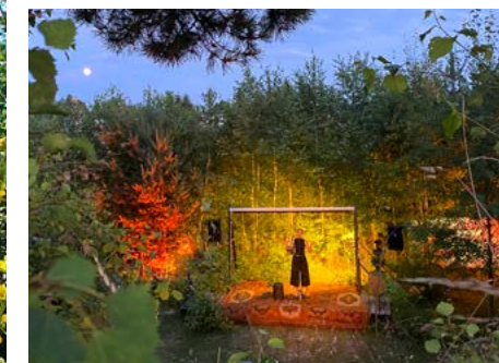
Melanie Grassinger singt auf der Waldbühne