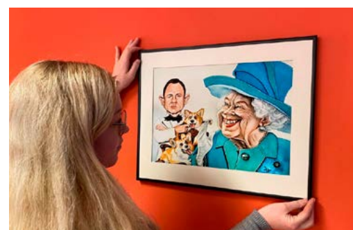
Im kleinsten Museum werden die sensationellen Karikaturen von Christian Gschöpf gezeigt.