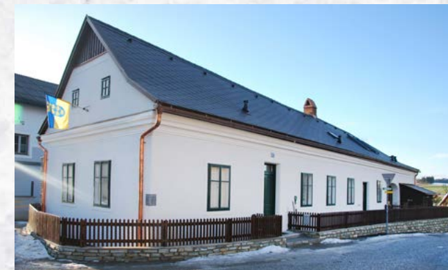
Der neu sanierte Treffpunkt am Hauptplatz von Albrechtsberg