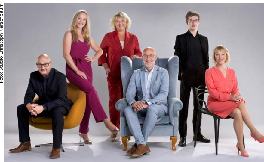
Das Team von waltergrafik freut sich auf Ihre Anfrage für ein unverbindliches Angebot!